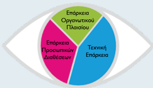
Το μάτι της επαγγελματικής επάρκειας

Κατά το IPMA, η επάρκεια στη διαχείριση έργου αναλύεται σε τρεις βασικούς τομείς: